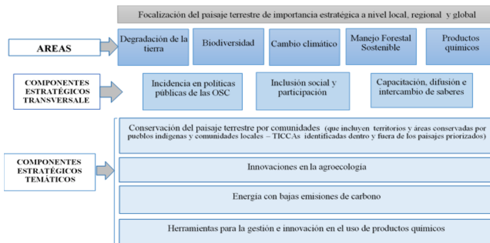
Figura 1. Diagrama de síntesis de la Estrategia Nacional PPD/OP6

Se brindará prioridad a aquellos proyectos que tengan componentes de incidencias en políticas públicas; inclusión social y participación ciudadana; y capacitación, difusión e intercambio de saberes. Por su parte, el 30% restante de los fondos CORE y STAR estará destinado a dar prioridad a aquellos proyectos que no estén dentro de los paisajes y que respondan a los criterios priorizados en la Estrategia PPD/OP6. En cuanto a la iniciativa GIS, los fondos podrán ser otorgados dentro o fuera de estos paisajes priorizados, sin considerar un porcentaje establecido como límite, siempre y cuando cumplan con los criterios establecidos para los TICCA 12 .